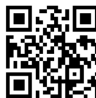
報名 QR code