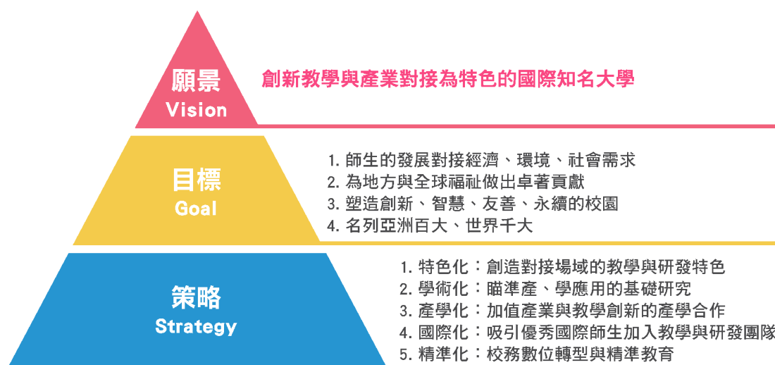
圖 2. Yuntech 中程計畫的願景、目標與策略